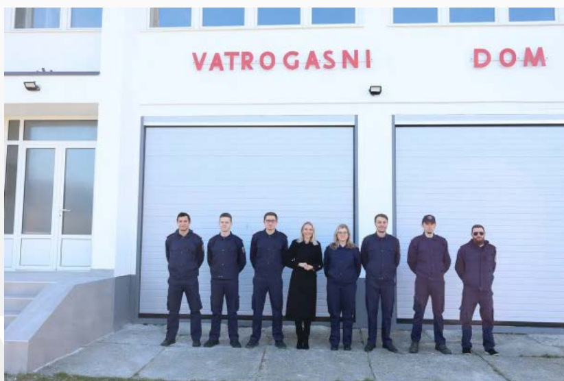
DVD Vatrogasni dom nakon obnove