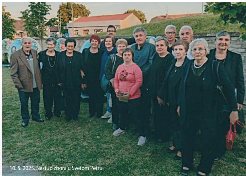
10. 5. 2025. Nastup zbora u Svetom Petru