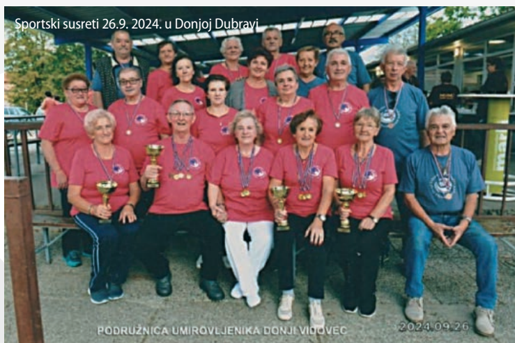
Sportski susreti 26.9. 2024. u Donjoj Dubravi