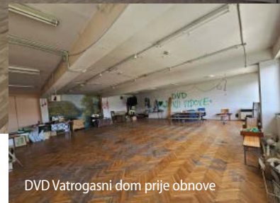
DVD Vatrogasni dom prije obnove

kvaliteta i usklađenost s važećim standardima. Radove je izvelo poduzeće ĐURKIN d.o.o. iz Čakovca, a ukupna vrijednost projekta iznosila je 67.128,43 EUR. Za realizaciju projekta Općina je osigurala 26.500,00 EUR putem natječaja Ministarstvo prostornog uređenja, graditeljstva i državne imovine – Poziv za sufinanciranje projekata JLS za poticanje razvoja komunalnog gospodarstva i ujednačavanje komunalnog standarda u 2025. godini, dok je preostali iznos od 40.628,43 EUR financiran iz proračuna Općine. Završetkom projekta osigurani su kvalitetniji, funkcionalniji i sigurniji prostorni uvjeti za rad vatrogasaca, čime Općina Donji Vidovec nastavlja kontinuirano ulagati u komunalnu infrastrukturu i jačanje lokalnih kapaciteta sustava zaštite i spašavanja.