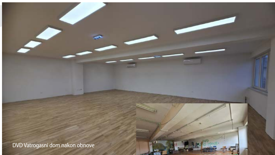
DVD Vatrogasni dom nakon obnove