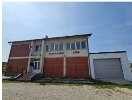
DVD Vatrogasni dom prije obnove

Dodali su kako su vatrogasci prethodnih godina vlastitim angažmanom sanirali temelje objekta kako bi spriječili daljnje propadanje zgrade, dok je novim spremištem napokon osiguran potreban prostor za vatrogasno vozilo.