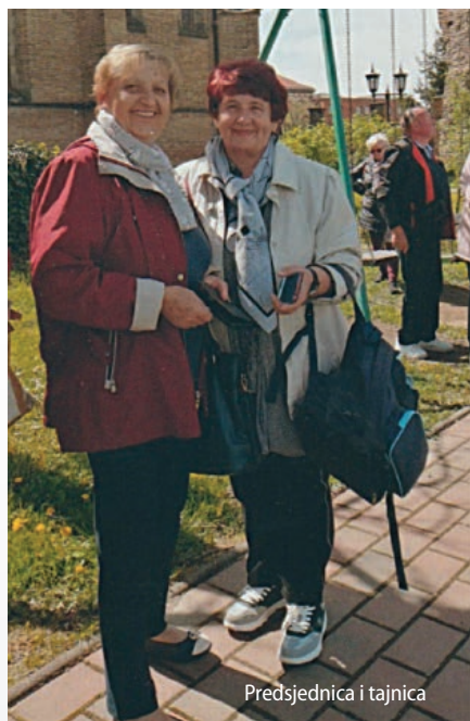
Predsjednica i tajnica

Udruga broji približno 188 članova, a taj se broj svake godine mijenja upisom novih članova.